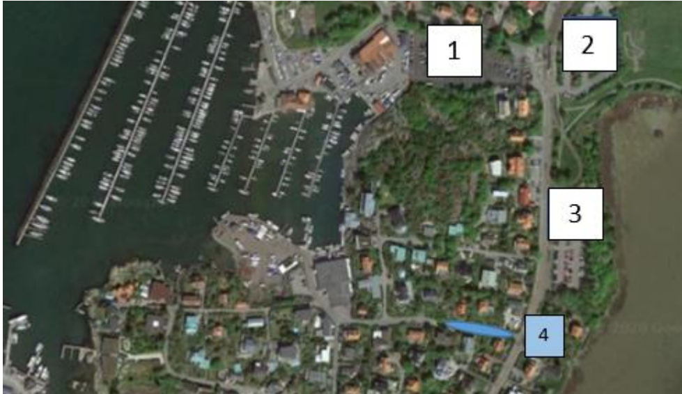
Figur 5. Översiktbild över det befintliga parkeringsutbudet i närområdet till projektområdet.

I villaområdet utanför fastigheten gäller att parkering sker inom respektive fastighet. I närområdet har Göteborgs stads parkeringsbolag även ett flertal parkeringsytor, se Figur 5. På Saltholmsgatan (3) finns 163 platser, varav 56 är förhyrda och övriga kan nyttjas med tillstånd. De förhyrda platserna kostar 700 kr/månad, det finns inga lediga och vid denna utrednings färdigställande stod 334 personer i kö för att få en plats. Vid Saltholmsgatan-Vikebacken (2) finns 197 besöksplatser där även de med tillstånd kan stå och vid Talattagatan (1) finns 236 besöksplatser där även de med tillstånd kan stå. Parkeringstillståndet LÅNGEDRAG gäller för Hinsholmskilen, Saltholmsgatan – Saltholmsgatan, Saltholmsgatan Vikebacken samt för Talattagatan. Tillståndet gäller för avgiftsbelagda platser, alla dagar 00–24. Priset för ett tillstånd är 480 kr/månad och i dagsläget står 26 personer i kö för att skaffa ett sådant tillstånd.