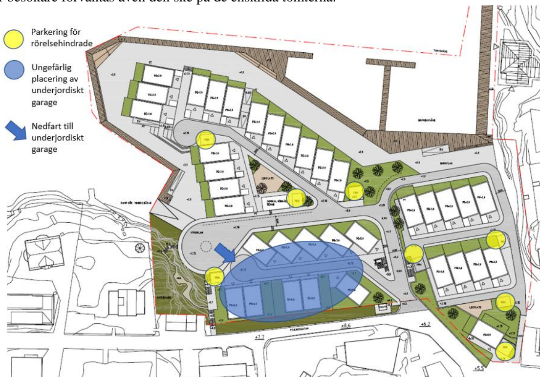
Figur 4. Illustrationsbild över tänkta parkeringsplatser för bil.

Då bostäderna utformas som radhus/småhus förväntas parkering av cyklar ske på den egna tomten. Det finns därför inga gemensamma anläggningar för cykelparkering inom området. Parkering av cykel för besökare förväntas även den ske på de enskilda tomterna.