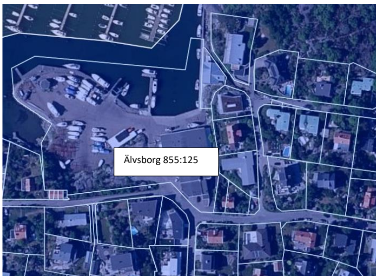
Figur 2. Fastighetsgräns för fastighet Älvsborg 855:125 (eniro.se).